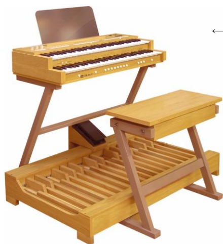
← フレーム・スタンドとの組み合わせ例 奥行 105cm、幅 117.5cm、高さ 95cm（譜面台を除く）

このオルガンは、 アンプとスピーカーを内蔵しておりません 。小型のアンプ内蔵スピーカーや、ご家庭のステレオ装置、演奏会場の音響設備に接続して使用します。また、ブロックオルガンの高音質を最大限に生かすべく、日本オルガン株式会社オリジナルの専用オルガンスピーカー（※1）もご用意しております。是非ご検討下さい。