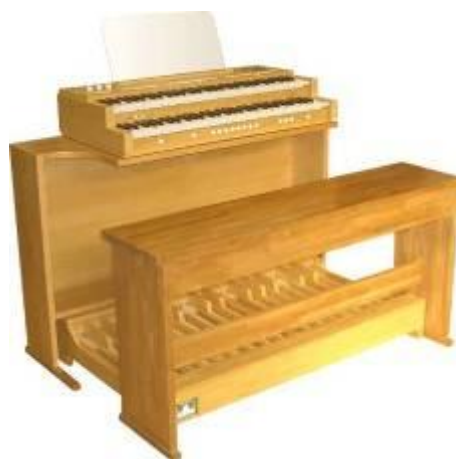
当社製木製スタンドとの組み合わせ例