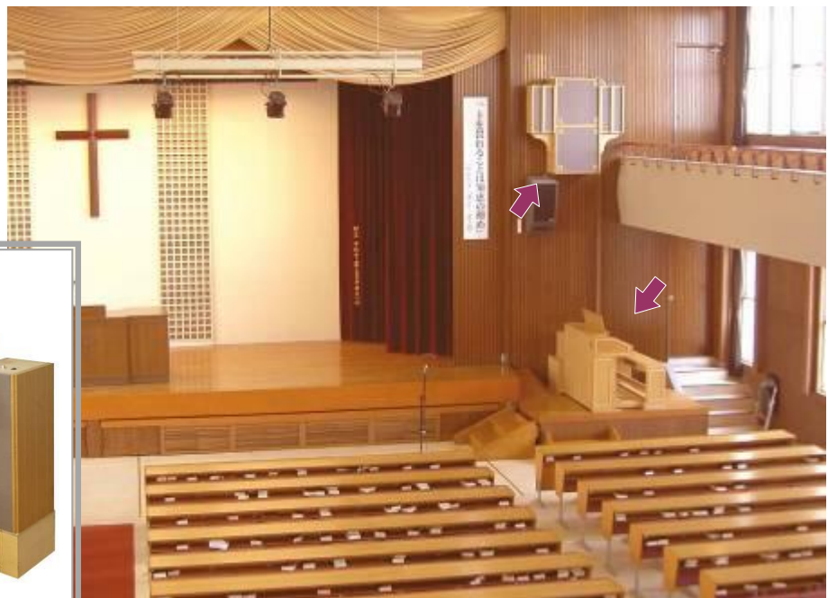
壁面スピーカーと C224 型設置例 ： 大阪キリスト教短期大学 様