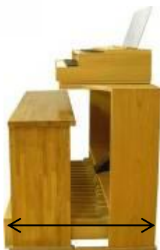
← 当社製木製スタンド（収納状態） 演奏時の奥行きは 95cm、収納時は 75cm です。 横幅は 133cm

※1 別途、オルガンスピーカーのカタログがございます。ご請求下さい。 巻末のオプション紹介もご覧下さい。