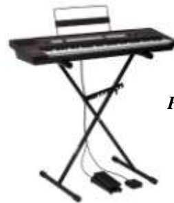
Parvus II オプション ・キーボードスタンド ・ソフトキャリングケース