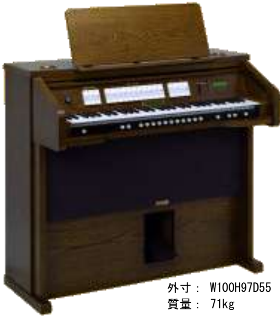
外寸： W100H97D55 質量： 71kg