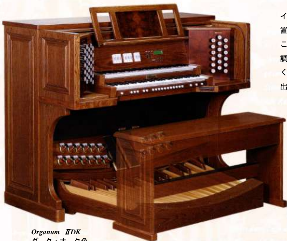
Organum IIDK ダーク・オーク色 BDO 規格 30 鍵ペダル平行・中凹

オルガナム・シリーズのすべてのオルガンでは、「 双方向プログラマー 」がお使いいただけます。この独自のリモコンユニットは、整音とセッティングにおいてとりわけ重要です。実際の聴取位置において、遠隔操作にてパラメーターを調整、変更することができます。