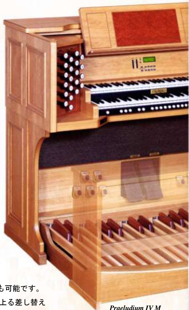
Praeludium IV M (生産完了)