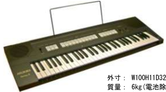
外寸： W100H11D32 質量： 6kg(電池除く)