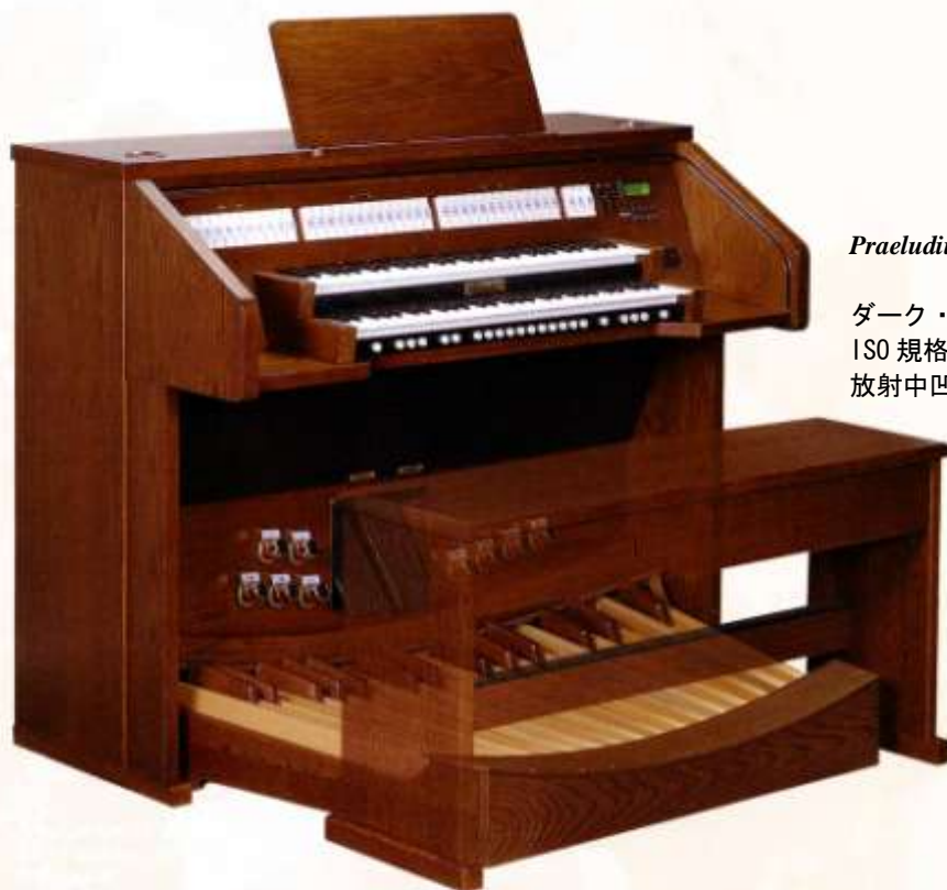
Praeludium IV D