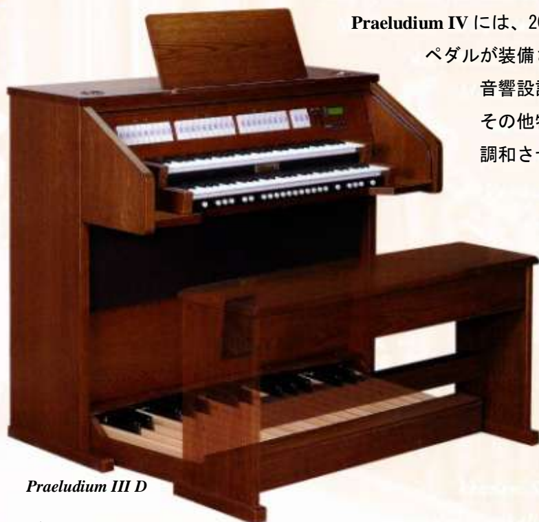
Praeludium III D

新しいプレリウド・シリーズを体験なさってみてください。その多彩さばかりでなく、音楽的で高度な音響の美しさにも感嘆なさることでしょう！